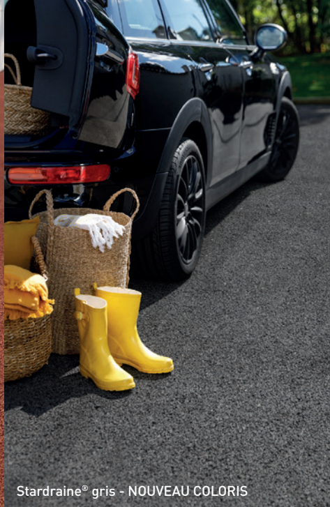
Stardraine® gris - NOUVEAU COLORIS