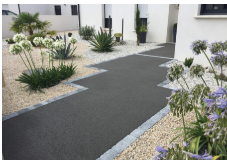
enrobé à chaud

L'aménagement paysager pour les particuliers est un secteur qui se porte très bien : il pèse 44% du marché et c'est une véritable bulle d'oxygène pour le marché avec une augmentation de + 1,5 %. Le réseau Daniel Moquet en est une belle illustration en affichant une croissance à 2 chiffres depuis 10 ans , 240 entrepreneurs sur la France, l'Allemagne et la Belgique. Fort de son expérience , le réseau se positionne comme acteur majeur de la filière du paysage en offrant tous les ans 200 contrats d'apprentissages et des CDI toute l'année à différents postes. A l'issue de l'apprentissage, le jeune est embauché une fois/2 et peut devenir franchisé s'il le souhaite. C'est le parcours professionnel dont on rêve quand on fait un apprentissage, l'élève aspire à devenir ou à dépasser le maître ! De plus, le métier paysagiste minéral est un métier qui a du sens car il contribue à l'embellissement des extérieurs et à la valorisation du patrimoine dont on peut être fier.