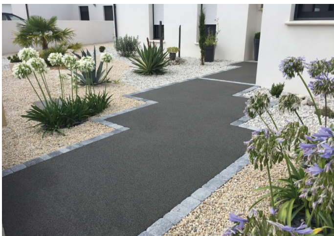
enrobé à chaud